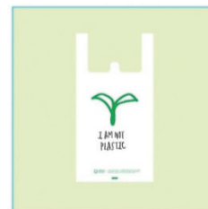
친환경 생분해 봉투 리그라운드