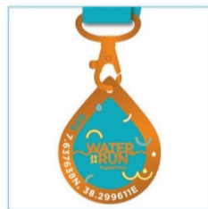
완주 메달(마그넷) *후원 지역 GPS 각인 팀앤팀