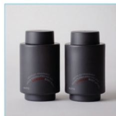
몽소 바디 워시+로션 SET 각 285ml 시타