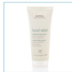
핸드크림 HAND RELIEF 40ml 아베다