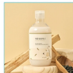
약콩 영양 토너 300ml 라운드랩